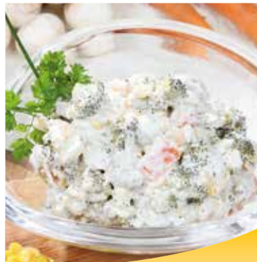
■ 3712 Broccoli-Salat mit Champignons

Blanchierter Broccoli, Tomaten, Champignons, Zwiebeln und goldgelber Mais in einer frischen Joghurtsauce.