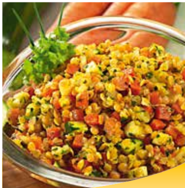
■ 2185 Rote Linsen-Salat

Leckerer Salat mit roten Linsen, Karotten und Zucchini in einer Vinaigrette.