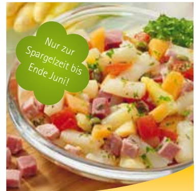
■ 10162 Spargel-Salat mit Melone

Ausgesuchter Spargel, Kochschinkenwürfel und frische Melone in Vinaigrette.