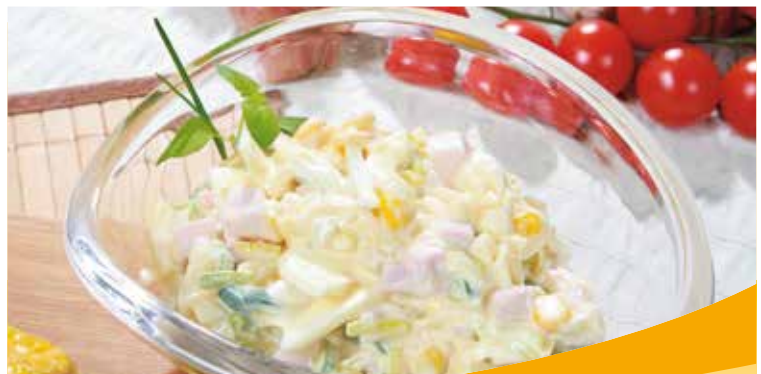
■ 3717 Frühlings-Salat

Fein geschnittener Porree, Eierscheiben, Kochschinkenwürfel, Ananas und Gemüse in einer angenehmen Joghurtcreme.