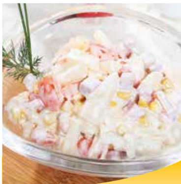
■ 3710 Spargel-Salat

Feine Spargelstücke, Kochschinkenwürfel und Tomaten in einem Joghurt-Sahnedressing.