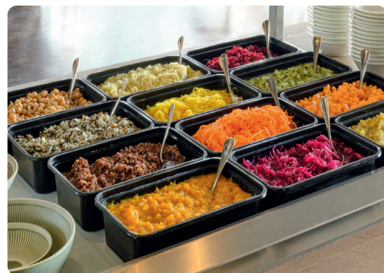
So kann's gehen: ein Beispiel für die Umsetzung unseres Build a Bowl Konzeptes

Unsere Bowls werden nie langweilig – inspiriert von den Jahreszeiten ergänzen wir unsere Zutaten um saisonale Produkte. Mit aromatischen Pfifferlingen im Herbst, erfrischem Wakame-Salat im Sommer oder gewürfeltem Hokkaidokürbis zu Halloween gleicht keine Bowl der anderen.